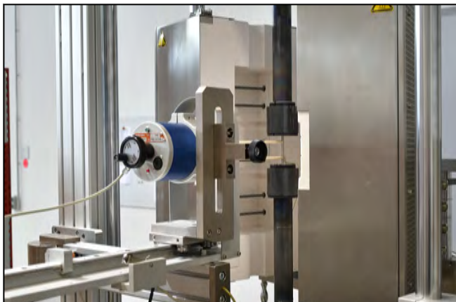
Kontaktierendes Hochtemperatur-Extensometer bis 1.500°C