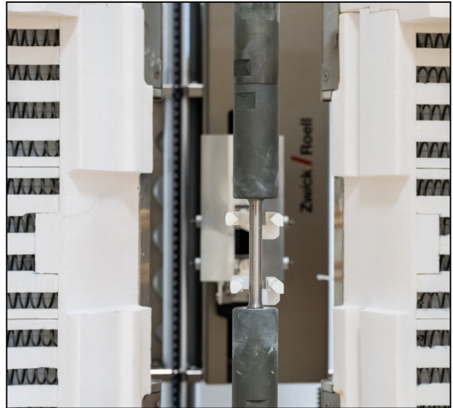
makroXtens II mit Keramik-Fühler für Temperaturen bis zu 1.200°C