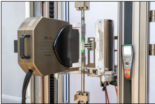
laserXtens 2-120 HP/TZ